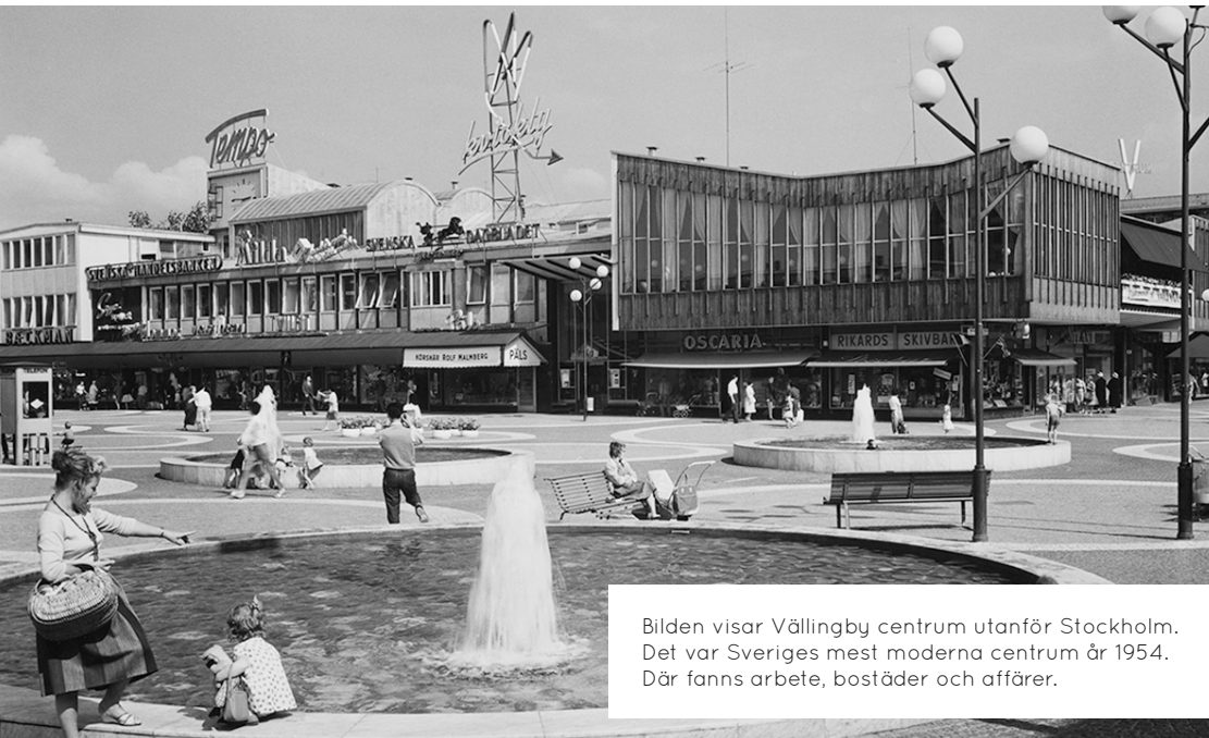
Bilden visar Vällingby centrum utanför Stockholm. Det var Sveriges mest moderna centrum år 1954. Där fanns arbete, bostäder och affärer.