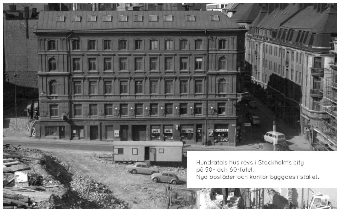
Hundratals hus revs i Stockholms city på 50- och 60-talet. Nya bostäder och kontor byggdes i stället.

Många tycker att det var fel att riva gamla hus, men på 1950-talet tyckte de flesta att det var bra att riva husen och bygga nya bostäder.