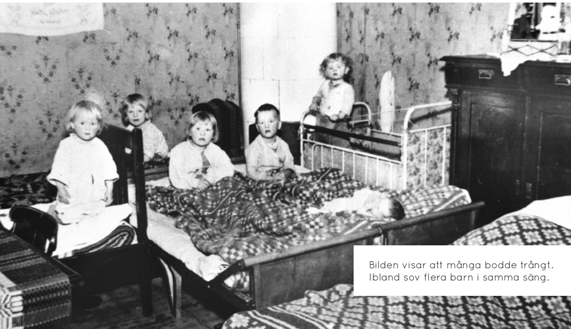
Bilden visar att många bodde trångt. Ibland sov flera barn i samma säng.

Han ville ha ett samhälle där folk har ett bra liv med bostad, mat och arbete och där människor samarbetar och hjälper varandra.