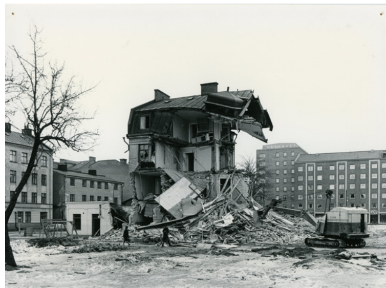
Bilden visar arbetet med att riva hus i Norrköping. Det var år 1971.