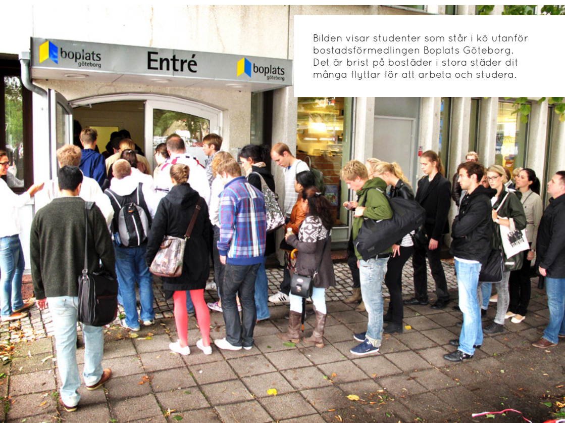
Bilden visar studenter som står i kö utanför bostadsförmedlingen Boplats Göteborg. Det är brist på bostäder i stora städer dit många flyttar för att arbeta och studera.