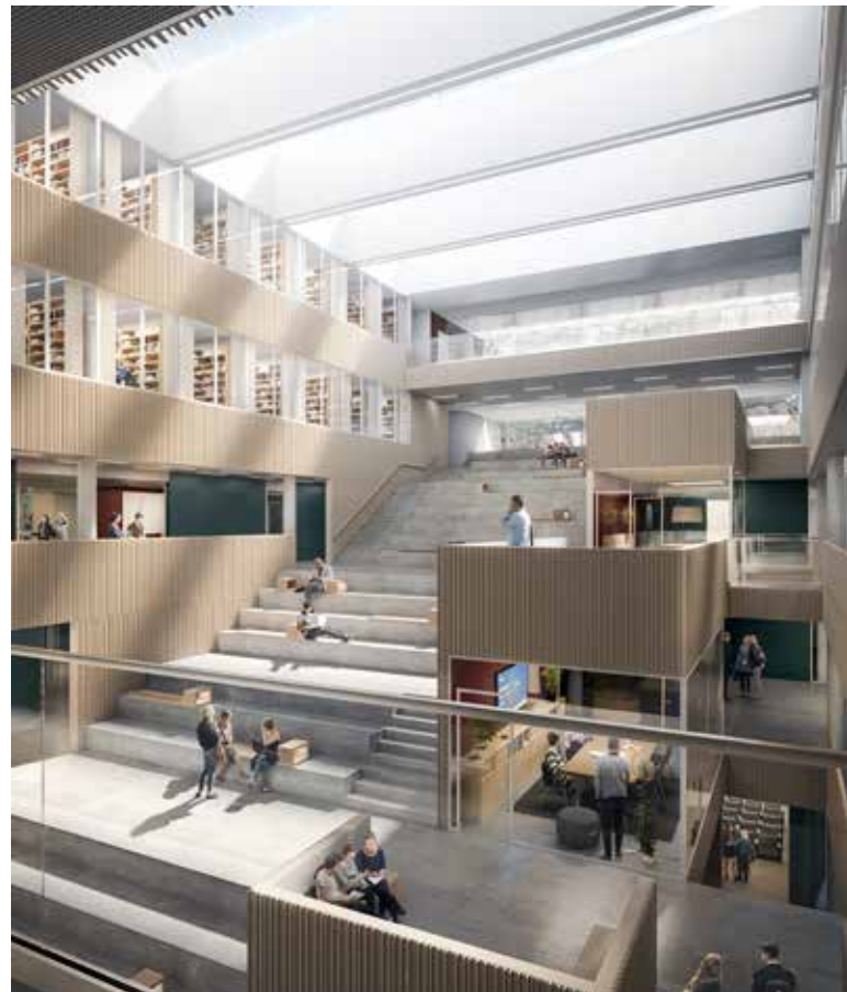
Från den nya cykelvägen som ska gå genom den nya byggnaden kommer det att gå att se rakt in i det centralt belägna trapprummet.

För mer information: www.projekthumanisten.hum.gu.se