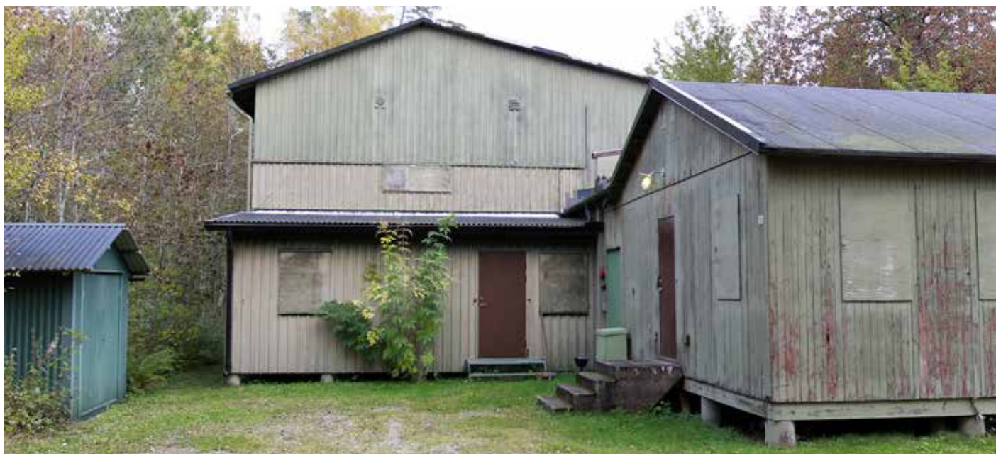
Ledningsplats Björn är en av många platser som minner om Sverige under kalla kriget. Nu har arkeologer undersökt den.

Det arkeologiska perspektivet innebär att utgå