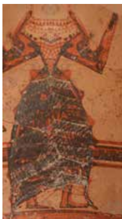
Mykensk (grekisk) vas som visar en kvinna i minoiska kläder (från Kreta).

– Grävningen under maj och juni blev den mest framgångsrika. Vi upptäckte en äldre stadsdel från omkring 1250 f.Kr. och utanför den en oerhört rik grav, en av de rikaste på Cypern från denna period, med tillhörande offergrop. Det faktum att vi har upptäckt ett gravfält från sen bronsålder är sensationellt eftersom man vid denna tid begravde de avlidna huvudsakligen inom bosättningen och ofta