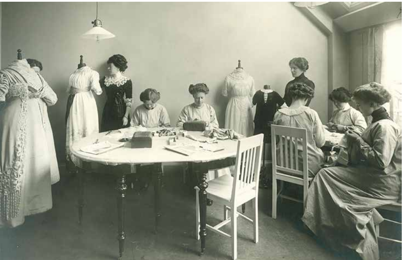
Fotografi från Birgittaskolan. Text på baksidan: "Sta Regeringsgatan 19-21, 1910".