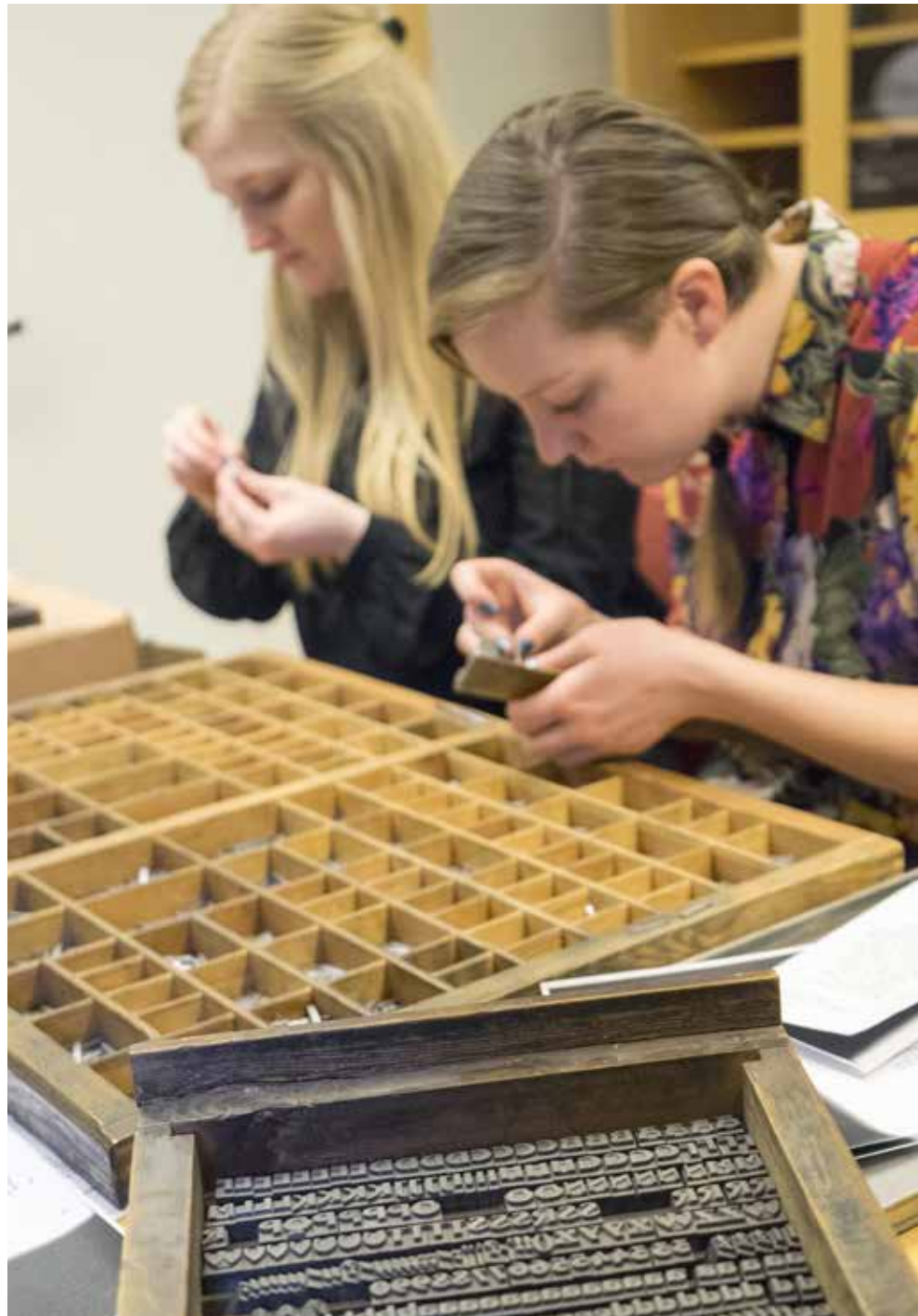
Att versaler på engelska kallas uppercase och gemener lowercase, beror på att de lådor, så kallade kast, som innehåller de olika typerna var placerade så i engelska tryckerier, versalerna ovanför gemenerna.