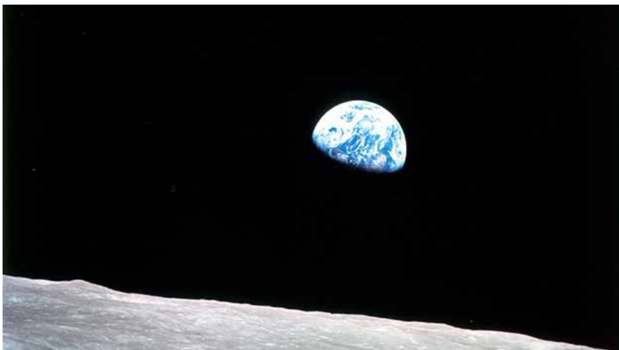
Den första fotografiska bilden av jorden, Earthrise at Christmas från 1968, väckte en vilja att ta hand om planeten.

– Avfallet kommer att vara farligt för allt levande i