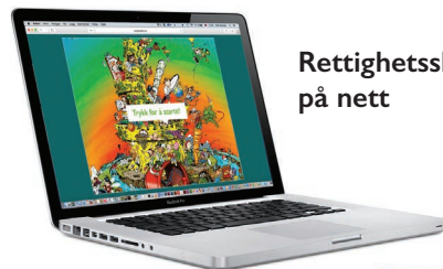
Rettighetsslottet på nett

Et interaktivt slott med filmer, bilder, lyd, tegninger og sanger. Er utgangspunktet for digitale slottsbesøk/undervisningsopplegg.