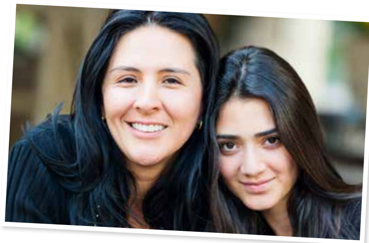
Personerna på bilden är inte de som nämns i texten.

Tycker du att Nawres ska säga något till Samira? I så fall, vad ska hon säga?