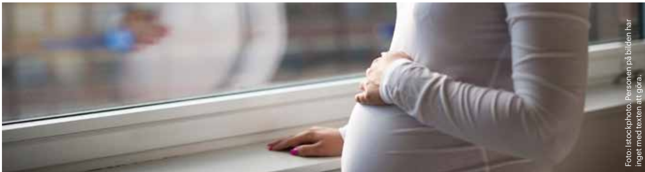
Personen på bilden har inget med texten att göra.