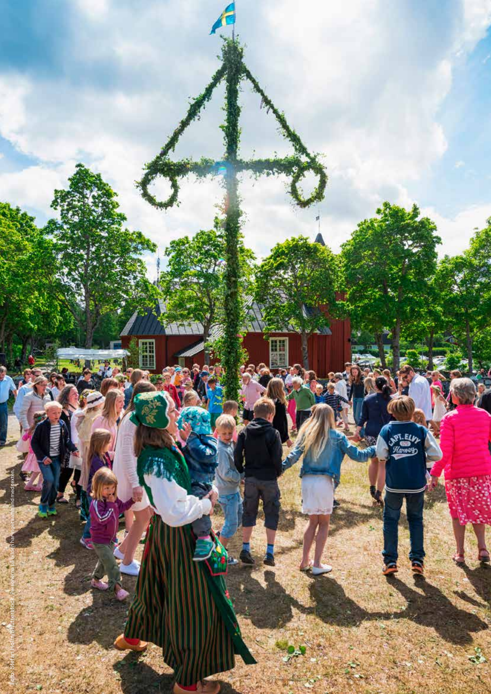
Foto: Stefan Holm/Snutterstock. Personerna på bilden har inget samband med texten.