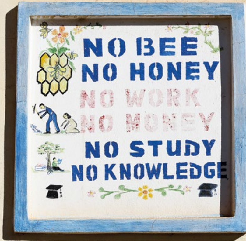
Toimeentulo vahvistaa osallisuuden kokemusta yhteiskunnassa.

tiedon ja verkostojen löytäminen internetistä helppoa ja nopeaa. Vaikka sivustojen liikennettä pyritäänkin tarkkailemaan, voi tilanne kehittyä niin nopeasti, ettei siihen ehditä reagoimaan. Juuri tiedon löytämisen vaarallisuus voi olla osa seikkailun ja kapi-nallisuuden tunnetta.