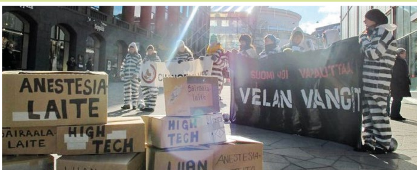
Changemakerin vuoden 2011 pääkampanja keskittyi kehitysmaiden epäoikeutettuihin velkoihin ja erityisesti Costa Rican sairaalalaitetapaukseen.

Talvina 2005 ja 2006 Changemaker ryhmä leiriytyi puolijoukkueletteltoihin Helsingin keskustaan viikoksi. Ydinryhmään kuului toistakymmentä opiskelijaa molempina vuosina. Telttakampanjoiden tarkoituksena oli havainnollistaa niiden ihmisten todellisuutta, jotka joutuvat selviytymään alle 2 eurolla päivässä, joten sen mukaisesti oli mm. suunniteltu leiriin niukat ateriat. Kampanjat järjestettiin hallituksen budjettineuvotteluiden aikaan ja tarkoituksena oli muistuttaa Suomen kehitysyhteistyömäärärahojen nostamisesta 0,7 prosenttiin BKT:sta. Se oli silloin Suomen tavoitteena vuodeksi 2010.