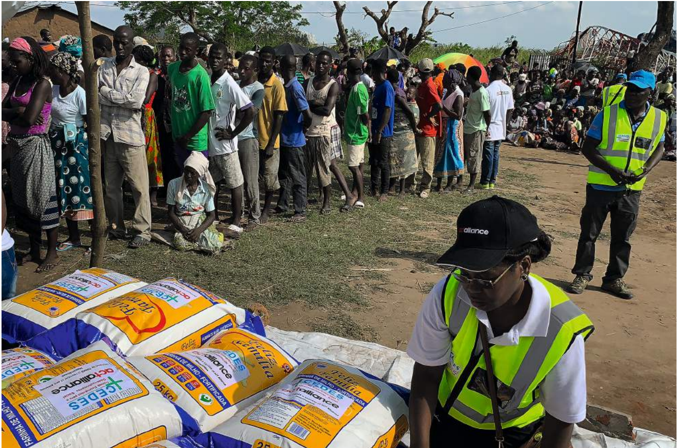
KUA:n yhteistyökumppanit Cedes ja ACT-Alliance jakoivat Idai-hirmumyrskyssä kotinsa menettäneille riisiä, papuja, öljyä, sokeria ja saippuaa.