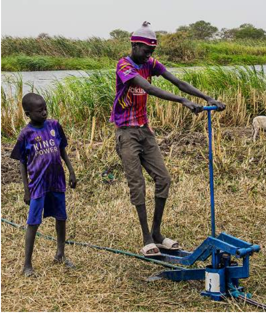
Vesipumppu kiinnostaa kylän nuorimpia.