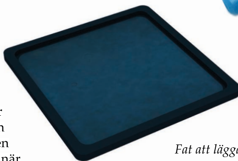
Fat att lägga markörerna på

Spelet går ut på att ta reda på vilka magiker de övriga spelarna har valt. Avslöjar man en motspelare vinner man dennes magiker. Den spelare som sist har kvar magiker på hand, när alla motspelare blivit av med sina, har vunnit!