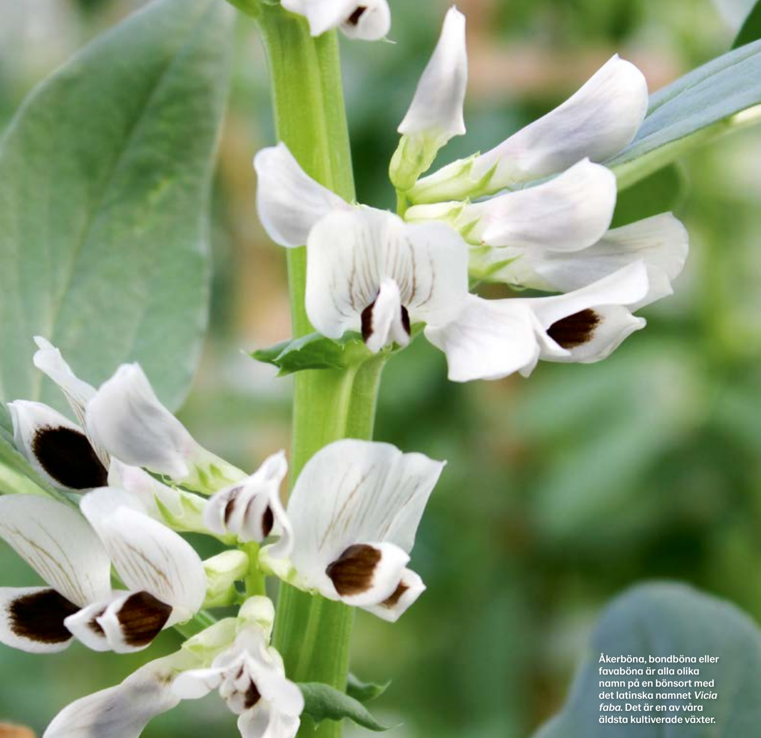
Åkerböna, bondböna eller favaböna är alla olika namn på en bönsort med det latinska namnet Vicia faba . Det är en av våra äldsta kultiverade växter.

frön till dagens moderna sorter som ofta är ljusbeiga, runda och lite mindre.