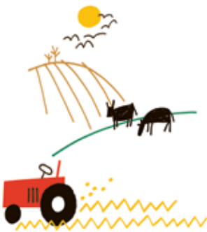
ILLUSTRATION: LENE DUE JENSEN