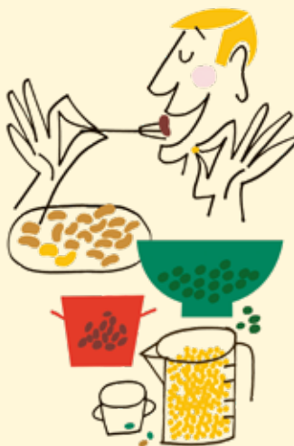
ILLUSTRATION: LENE DUE JENSEN